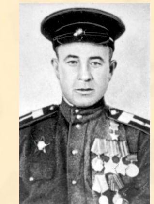
ЧИЯНЁВ Пётр Александрович

Родился 22 мая 1919 года в селе Санское Спаского уезда Рязанской губернии. Из награжденного листа: «... В бою 3 февраля 1945 года при удержании плацдарма на западном берегу противник в течение 6 раз контратаковал наши позиции силами до 2-ух батальонов пехоты, поддерживаемыми 16-тью танками и 10-тью бронетранспортерами, пытаясь сбросить наши войска с занимаемого плацдарма. При отражении контратаки, стрельбой прямой наводкой, огнём своего орудия подбил 2 танка и уничтожил до взвода пехоты противника. На следующий день противник 3 раза контратаковал наши боевые порядки силою до 3-ех батальонов, поддерживаемых 15-тью танками и 5-тью бронетранспортерами. ... Находясь на прямой наводке в боевых порядках пехоты, вступил в неравный бой с 3-мя танками, огнём из своего орудия уничтожил один танк, а остальные обратил в бегство...» Звание Героя Советского Союза присвоено 24 марта 1945 года. Умер 6 сентября 1996 года, похоронен в родном селе.